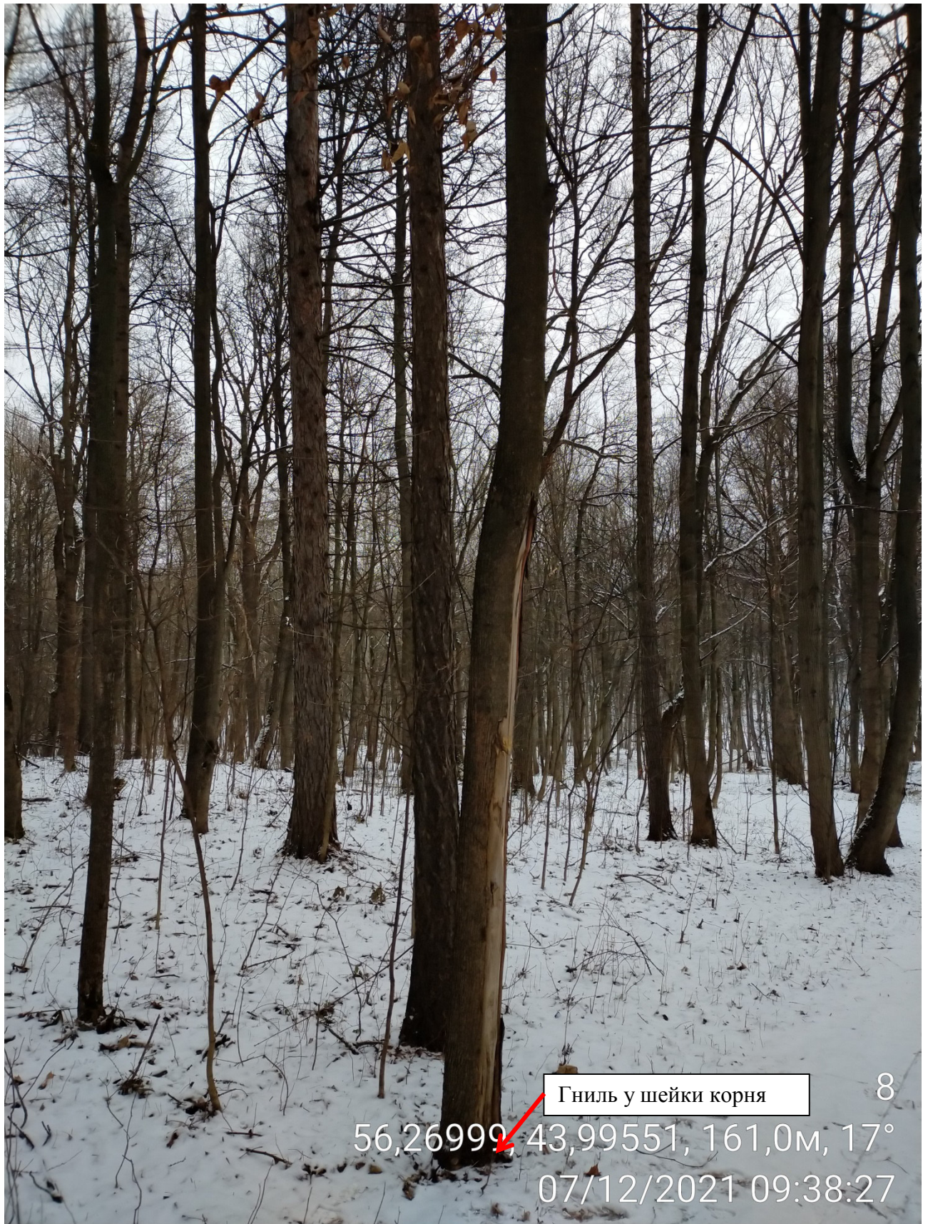
Дерево № 8